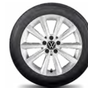
Merano, 16" briliantovo strieborné