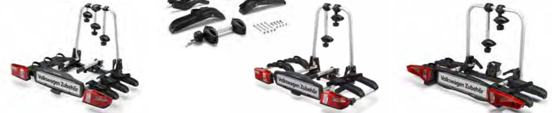
Nosiče bicyklov na ťažné zariadenie