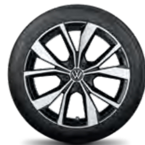
Misano, 18" čierne, lesklá úprava