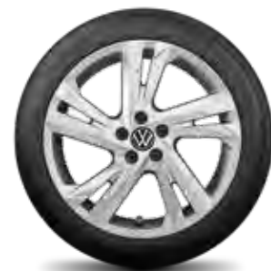
Valencia, 17" sivá galvano metalíza