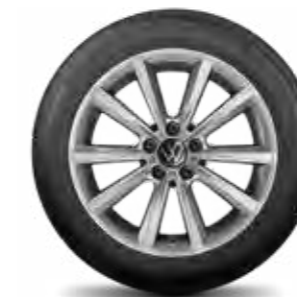
Merano, 16" tmavá adamantium metalíza