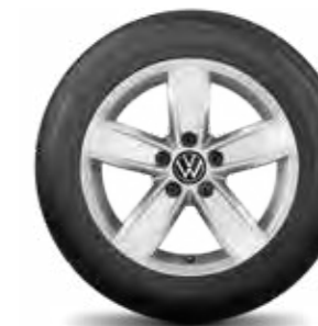
Corvara, 16",17" briliantovo strieborné

Ďalšie príslušenstvo pre vaše kolesá ako napr. krytky ventilov, poistné skrutky, ochranné obaly na kolesá či snehové reťaze nájdete v časti univerzálneho príslušenstva na strane 221.