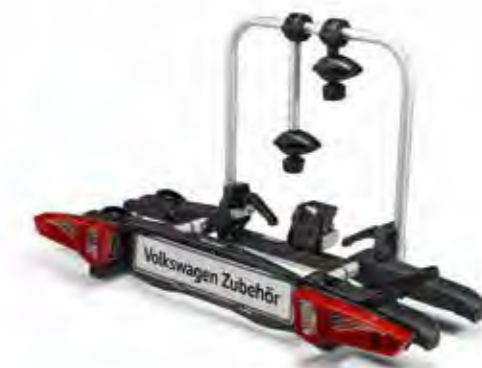
Nosiče bicyklov na ťažné zariadenie