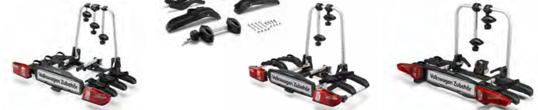
Nosiče bicyklov na ťažné zariadenie