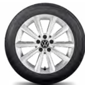
Merano, 16", 17" briliantovo strieborné