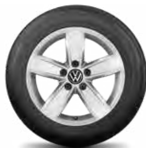
Corvara, 16", 17" briliantovo strieborné