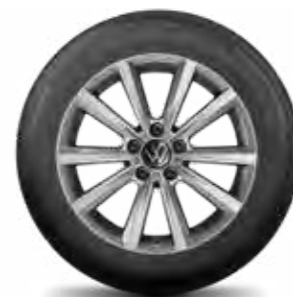
Merano, 17" tmavá adamantium metalíza