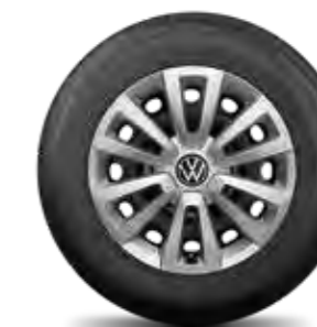
Lichobežníkový dizajn 16"

Ďalšie príslušenstvo pre vaše kolesá ako napr. krytky ventilov, poistné skrutky, ochranné obaly na kolesá či snehové reťaze nájdete v časti univerzálneho príslušenstva na strane 221.