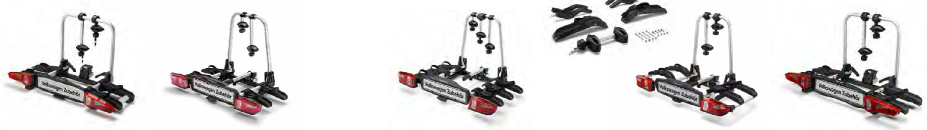
Nosiče bicyklov na ťažné zariadenie

Na upevnenie vášho Originálneho nosiča bicyklov Volkswagen je možné použiť výrobcom štandardizované rozhranie FIX4BIKE. Užitočné zaťaženie sa tým nezvyšuje.