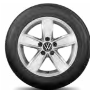
Corvara, 17" briliantovo strieborné